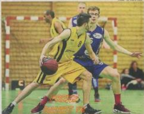
Les Sablons (en jaune), ici avec Rivorseau, ont remporté le derby marcéais.